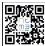
App TMB Mobility

F Ce calendrier PRÉVISIONNEL fait l'objet d'évolutions. Une version à jour est associée au QR Code ci-contre, ainsi que publiée sur la app TMB Mobility et sur le site www.tunnelmb.net .